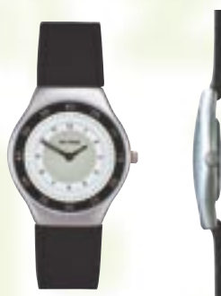
702.658 ø 3,3 cm od 624 Kč