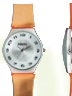
702.339 ø 3,3 cm od 450 Kč